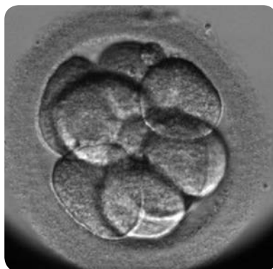
Embryon au stade de huit cellules

Vous entendrez peut-être le mot cryo-préservation : il désigne à la fois la congélation et la conservation.